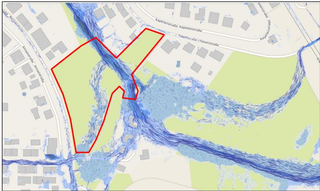
Abbildung 4: Starkregengefahrenkarte