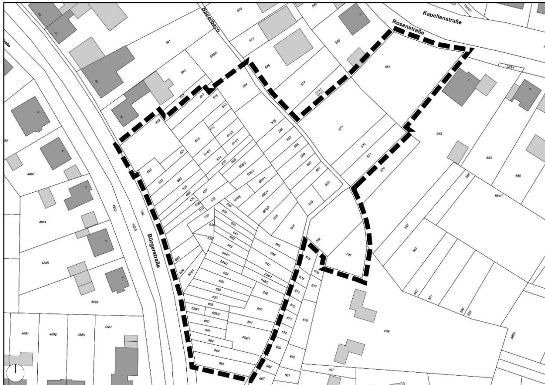
Abbildung 1: Abgrenzung des räumlichen Geltungsbereichs