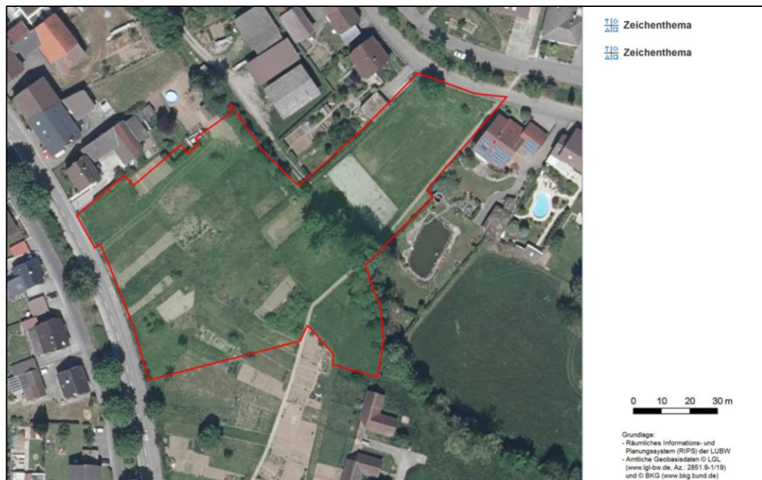
Abbildung 2: Nutzungen im Umfeld - rote Linie: Bereich mit Änderungen der Festsetzungen