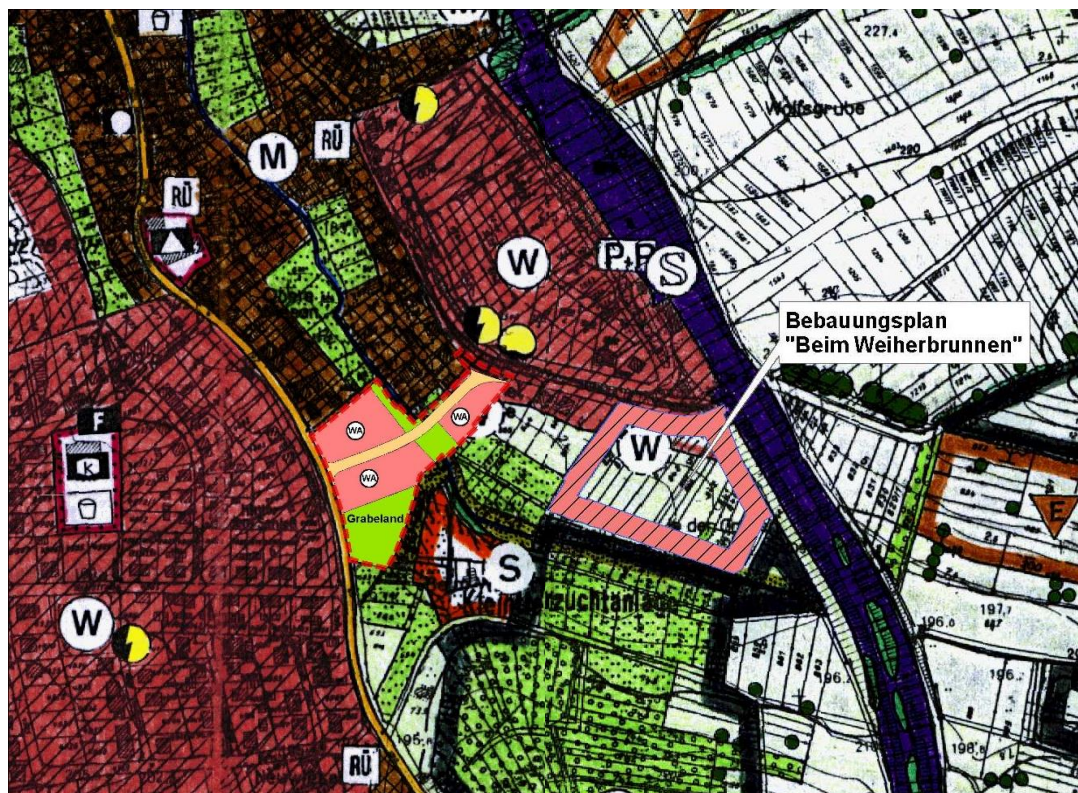
Abbildung 5: Darstellungen des wirksamen Flächennutzungsplans

Seitdem stellt der Flächennutzungsplan südlich und nördlich des Bauerbachs Wohnbauflächen dar. Rund um den Bauerbach sowie im Süden des Geltungsbereichs stellt der Flächennutzungsplan fortan Grünflächen dar. Durch die nun vorliegende 1. Änderung ist der Flächennutzungsplan erneut zu berichtigen.