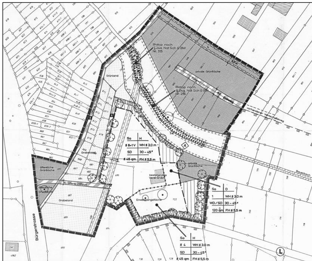
Abbildung 7: Bebauungsplan Sondergebiet Kleintierzuchtanlage Bauerbach