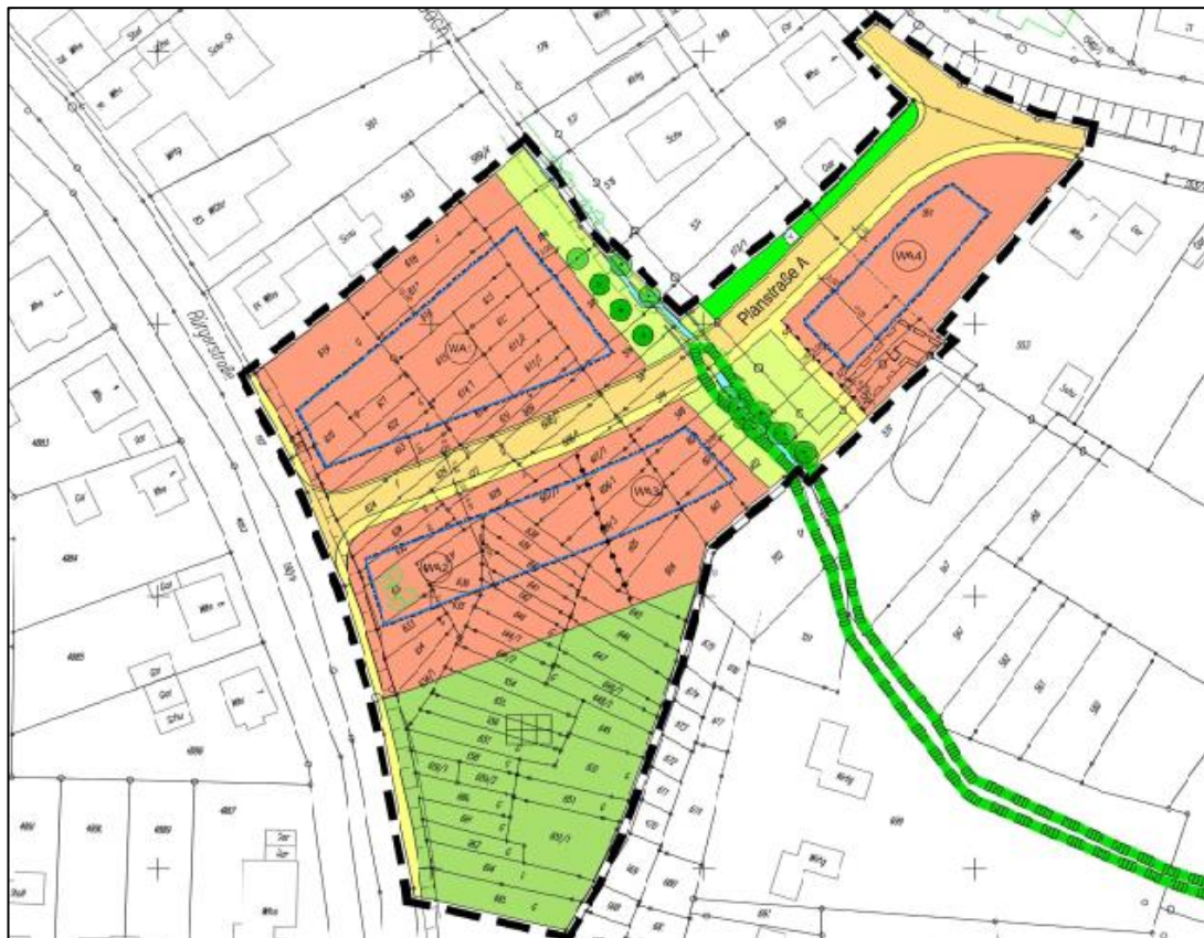
Abbildung 6: Bebauungsplan „Obere Krautgärten“

städtebauliche Konzept erfordert insbesondere die Einbeziehung weiterer Flächen im Norden (Teilfläche des Flurstücks Nr. 151 Bauerbach) und im Osten (Flurstück Nr. 701, 702). Letztere liegen derzeit innerhalb des Bebauungsplans „Sondergebiet Kleintierzuchtanlage Bauerbach“. Auf diesen Flächen ist ein Regenrückhaltebecken vorgesehen, welches dementsprechend als Fläche zur Rückhaltung und Versickerung von Niederschlagswasser vorgesehen ist. Weitere Änderungen betreffen insbesondere die geänderte Erschließung und damit einhergehend die Anordnung der Wohnbauflächen und überbaubaren Grundstücksflächen sowie die Festsetzungen zur Straßenverkehrsfläche. Eine Durchfahrt nach Norden ist nicht mehr vorgesehen. Entlang der Rosenstraße wird weiterhin eine Wohnbaufläche festgesetzt. Die südlich daran anschließenden Flächen sollen fortan nicht mehr baulich genutzt werden. Hier soll zukünftig eine öffentliche Grünfläche festgesetzt werden. Unverändert übernommen wurden die privaten Grünflächen im Süden sowie die öffentlichen Grünflächen rund um den Bauerbach. Gleiches gilt teilweise für die landschaftspflegerischen Maßnahmen im Bereich des Bachbettes (Anlage eines Wiesensaums). Weitere Änderungen betreffen das Maß der baulichen Nutzung sowie vereinzelte bauordnungsrechtliche Vorschriften. Auf Grund der geänderten Planungskonzeption und der erneuten artenschutzrechtlichen Betrachtung wurden im weiteren Verfahren weitere Artenschutz-Maßnahmen ergänzt.